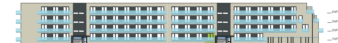
Severní pohled na dům / Building View - north side